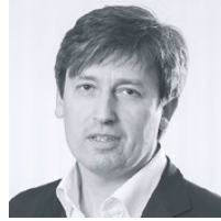
Dipl.-Ing. Christian Pelzeter Architekt BDA Heinle, Wischer und Partner, Freie Architekten GbR, Berlin

14.00 Uhr Begrüßung durch den Vorsitzenden der AKG